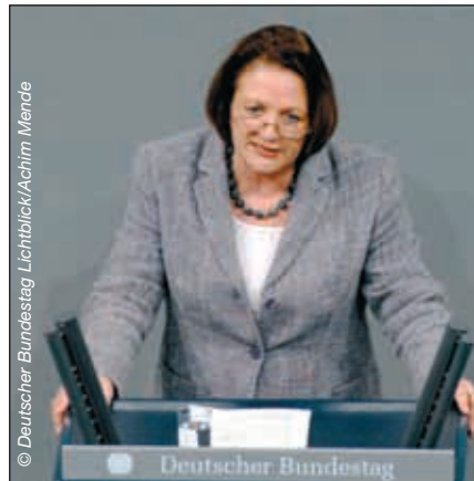
„Von der Dauerbaustelle zu einem in sich geschlossenen Neubau.“ Justizministerin Sabine Leutheusser-Schnarrenberger ist von der Neuregelung überzeugt

Schließlich wird das gesetzgeberische Konzept um ein „Gesetz zur Therapie und Unterbringung psychisch gestörter Gewalttäter“ (Therapieunterbringungsgesetz - ThUG) ergänzt. Das Gesetz erfasst die Fälle, in denen infolge des Urteils des Europäischen Gerichts-